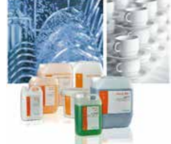
Lavado Automático Vajillas