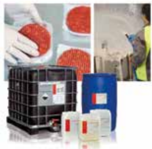
Limpeza y desinfección circuitos (C.I.P.) y Superficies (O.P.C.)