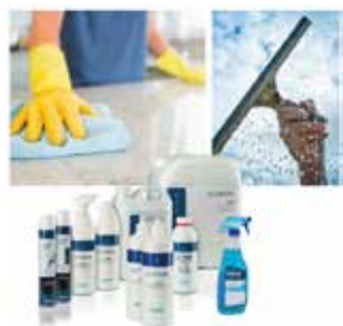
Limpeza General y Baños