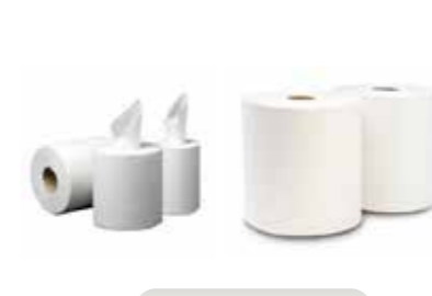
Bobina Industrial y secamanos