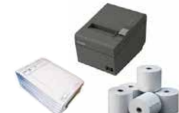
Rollo eléc/térmico y comanda