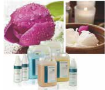
Ambientadores y desodorizantes