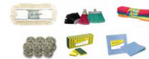
Útiles de limpieza