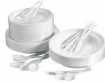
Vasos, platos y cubiertos