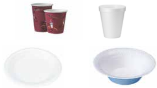
Vasos y platos