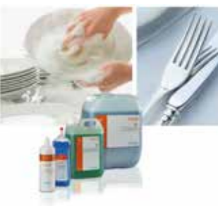
Lavado Manual Vajillas