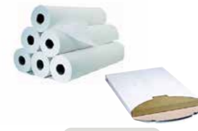
Rollo camilla y papel de horno