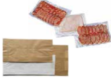
Bolsas papel y de vacío