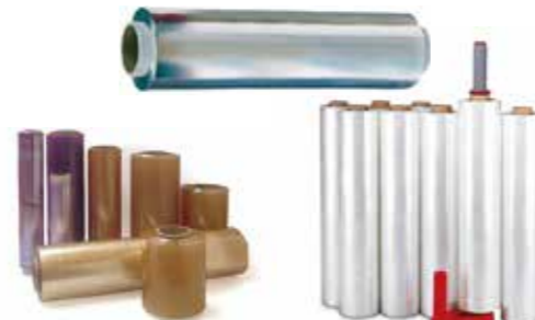
Rollo aluminio/film y film de paletizar