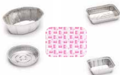
Moldes de aluminio