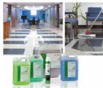
Limpeza y Tratamiento de suelos