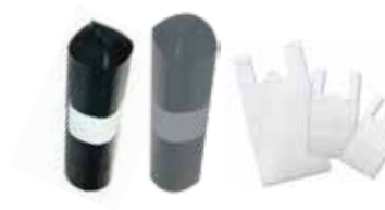
Bolsas de basura y bolsas de camiseta