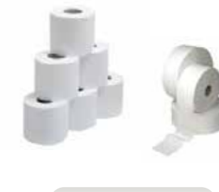
Higiéico Industrial y doméstico